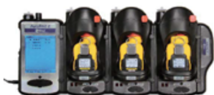
自動点検・校正器 AutoRAE2