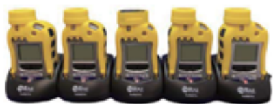
マルチチャージャー