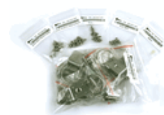
アリゲータークリップ