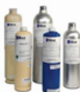
校正用ガスシリンダー