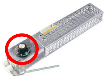
サーモスタット付スペースヒーター