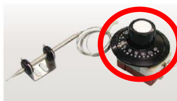
サーモスタット（単体）