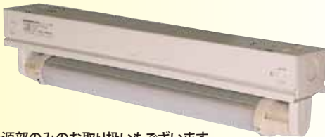
光源部のみのお取り扱いもございます。 品番:FLED-1010 電源リード長:1m